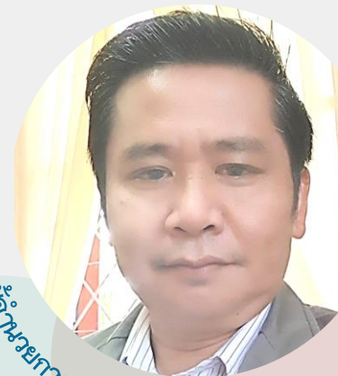
ผู้อำนวยการสถาบันพัฒนาฝีมือแรงงาน 18 อุตรดิตถ์

(ข้าราชการ 15 คน ลูกจ้างประจำ 8 คน พนักงานราชการ 5 คน ลูกจ้างกองทุน 2 คน รวมทั้งสิ้น 30 คน)